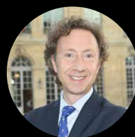
Stéphane BERN Journaliste Historien