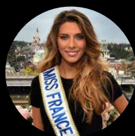
Camille CERF Miss France 2015

100 personnes sont attendues, comprenant des personnalités économiques, politiques, publiques ainsi que des experts pour vous divertir tout au long de la soirée.