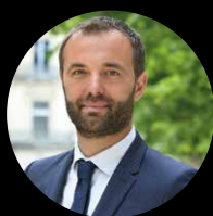
Mickaël DELAFOSSE Maire de Montpellier